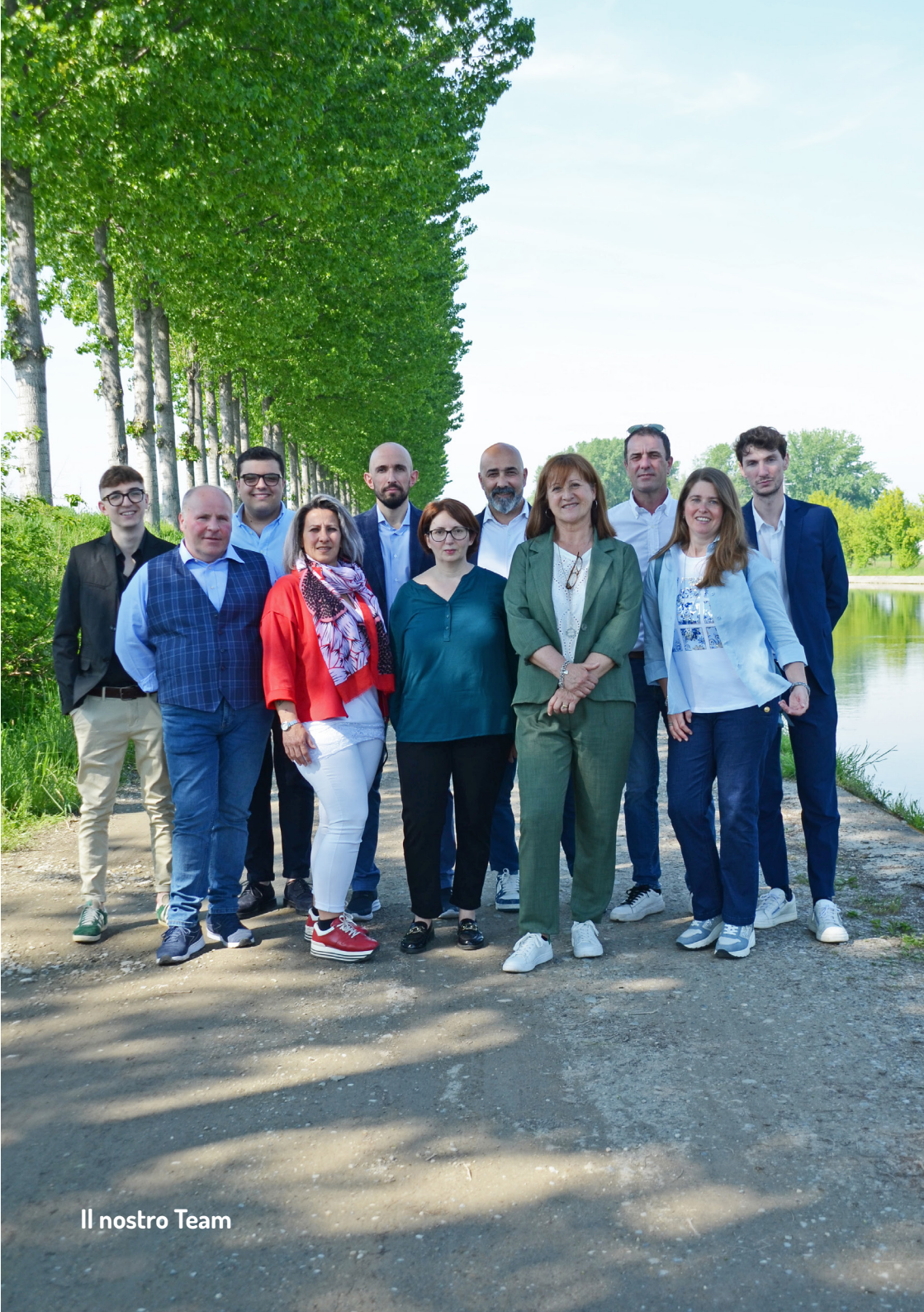
Il nostro Team