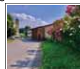
Ingresso da Quartiano