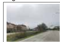
Ingresso via Molino

Esporre i rifiuti dalle ore 20:00 del giorno precedente alle ore 6:00 del giorno di raccolta.