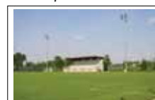
Campo da calcio