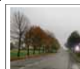
Ingresso da Lodi