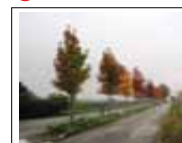
Ingresso dal cimitero