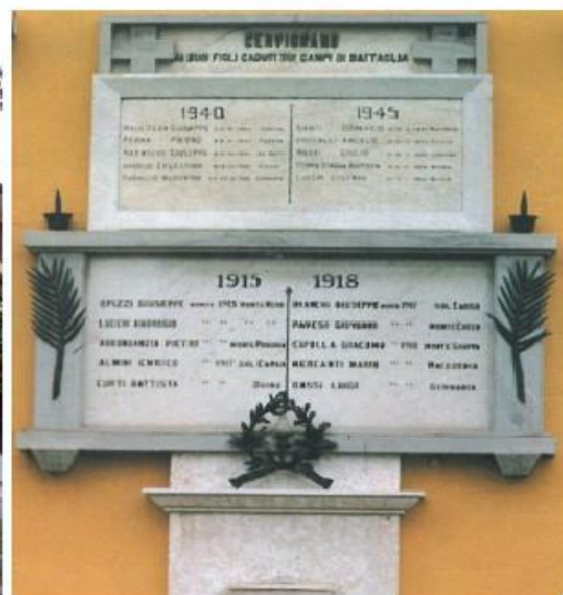
Cervignano d'Adda – 1947 Ai sui figli caduti sui campi di battaglia 1915-1918 e 1940-1945