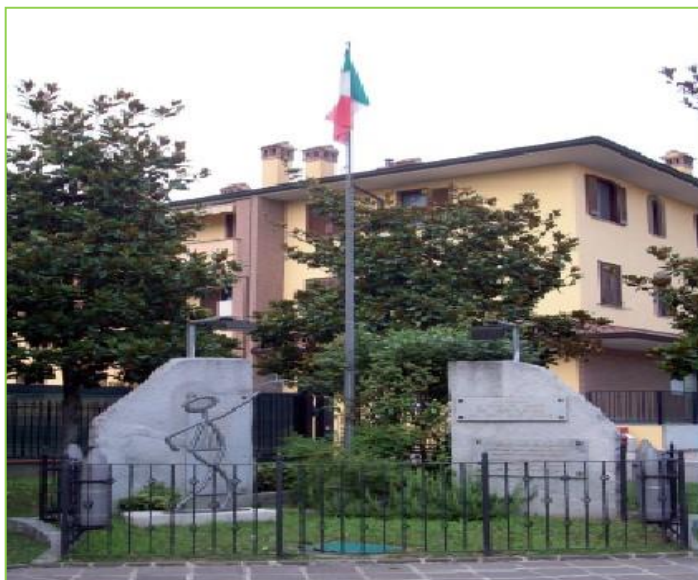
Cervignano d'Adda 04.06.1995 Nuovo monumento "alla pace"