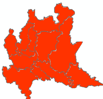
OGGI MARTEDÌ 23/06