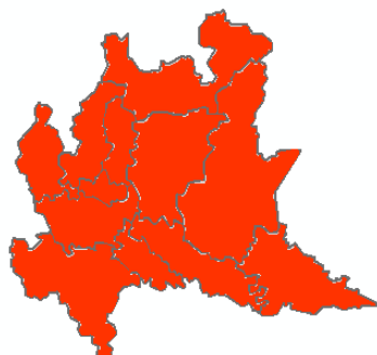
IERI LUNEDÌ 22/06