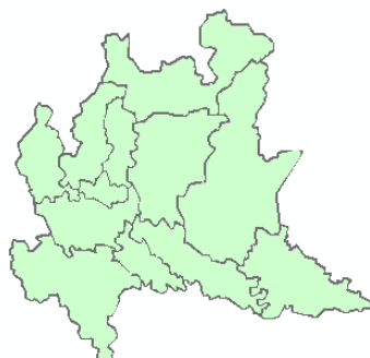
DOMANI GIOVEDÌ 11/06