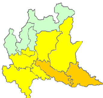
OGGI MERCOLEDÌ 10/06